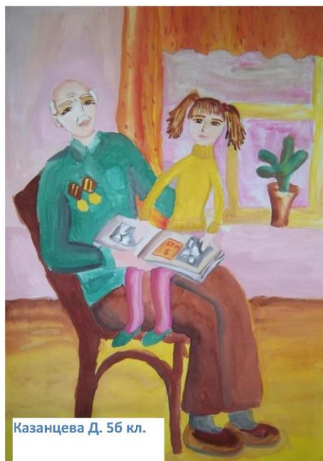
Казанцева Д. 56 кл.